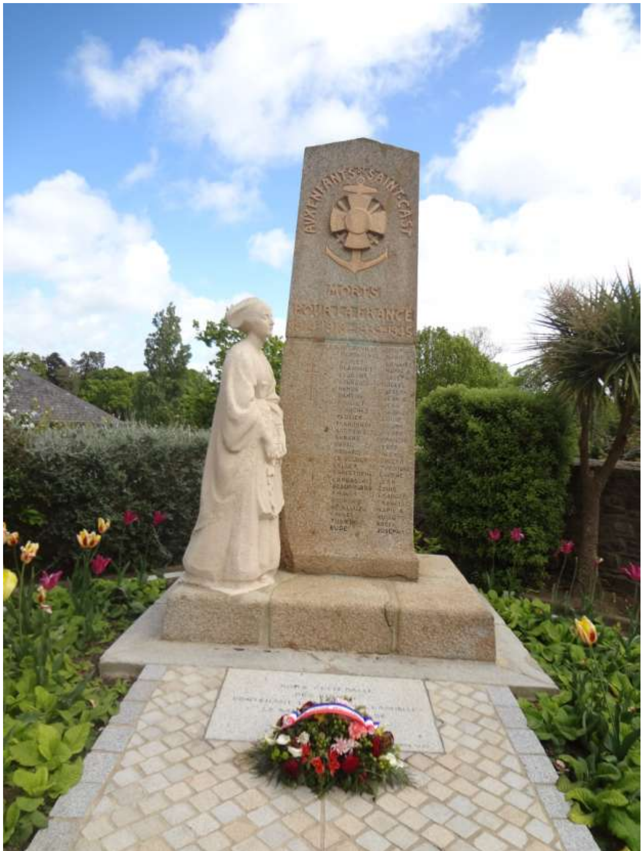
WW1 Memorial at Saint-Cast Pluduno.