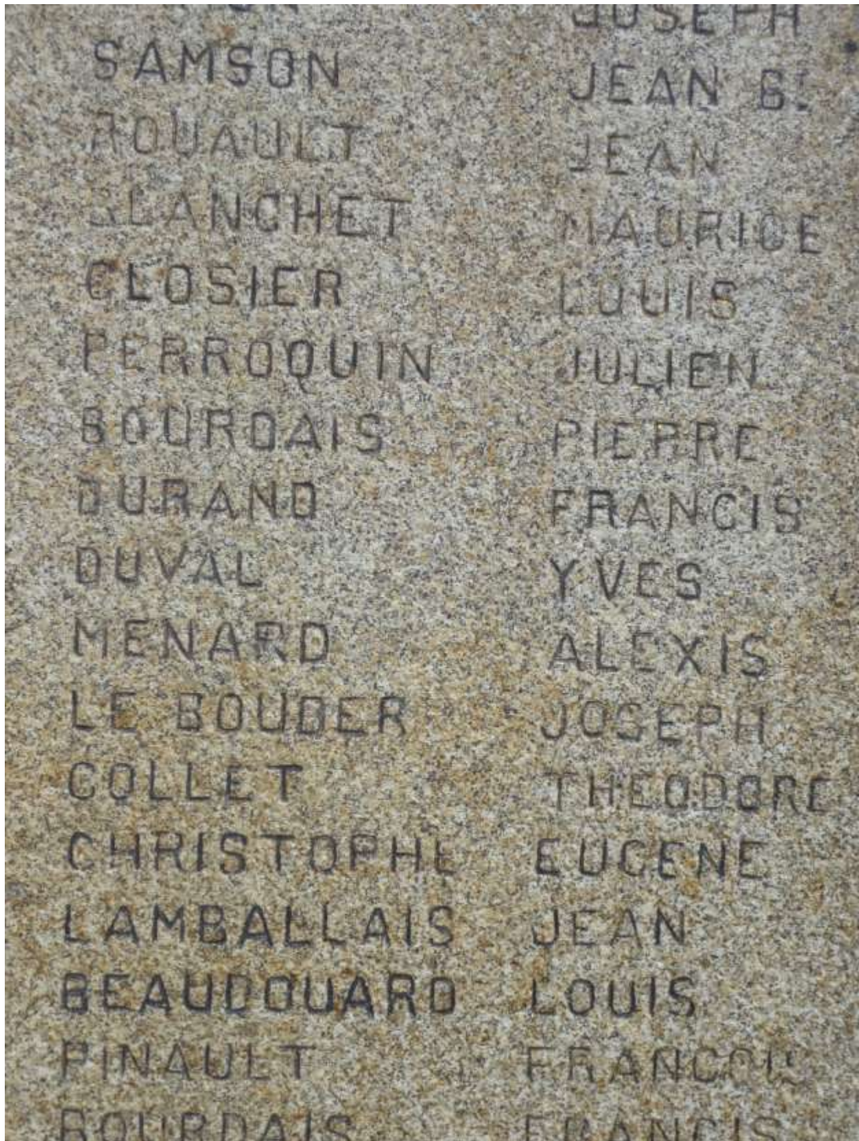
Father Ménard's name on the WW1 Memorial at Saint-Cast Pluduno.